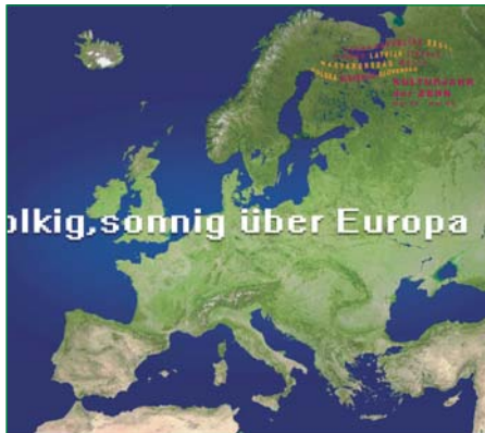
Plakatmotiv der Veranstaltungsreihe